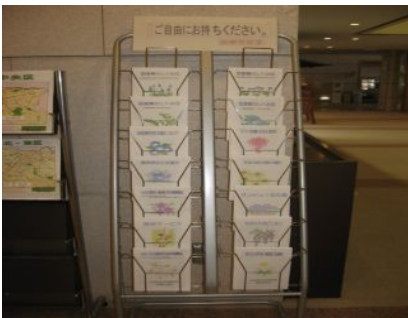
【サービス紹介コーナー】