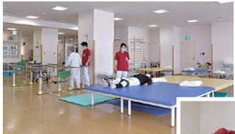
リハビリテーション室